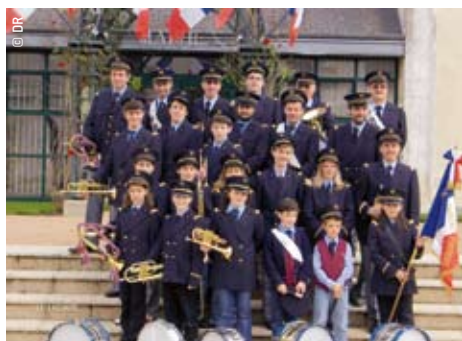
> Les fanfares et batteries-fanfars savent partager leur bonheur de jouer (ici, La Ville-aux-Clercs).

de plus en plus de mal à assurer. Le schéma prend en compte cette difficulté et propose notamment de simplifier les démarches et de mettre en place une mission de conseil pour aider les écoles dans leur gestion administrative. ●