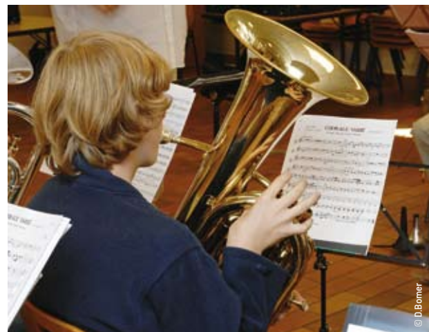
> L'Aicem inscrit son développement dans le cadre du schéma des enseignements artistiques.

L'Aicem rémunère 15 professeurs. C'est bien sûr une charge financière, mais aussi administrative, que le personnel, bénévole, a