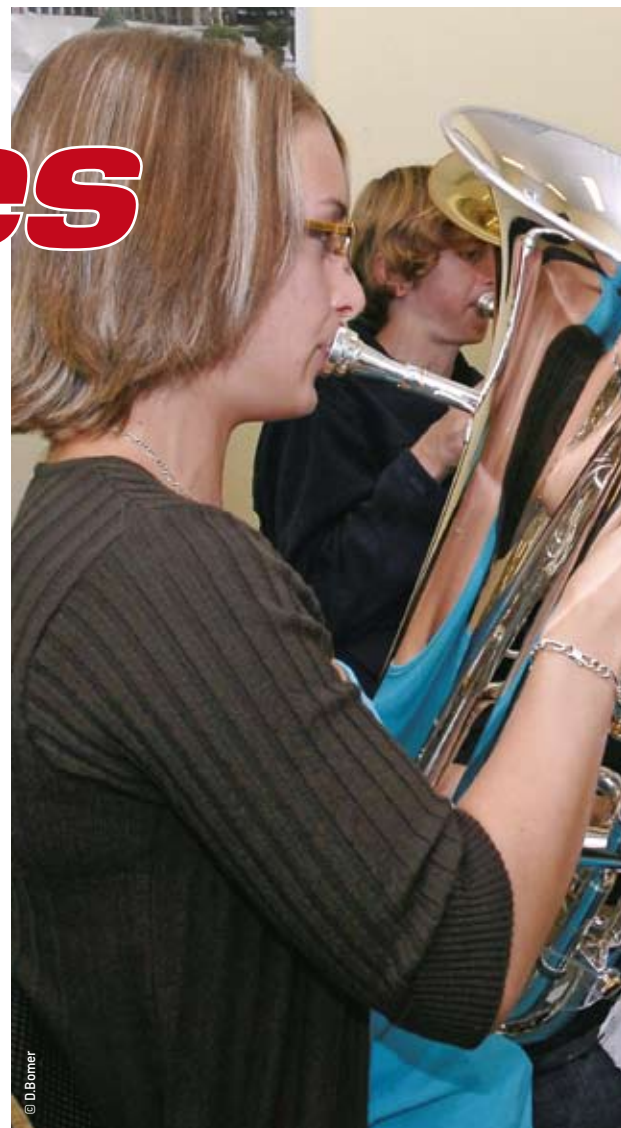
> Un schéma pour que tous les acteurs des enseignements artistiques agissent de concert.

Concertation, rencontres et écoute ont permis de cerner les besoins et les objectifs à atteindre. Et, pour poursuivre ce travail commun, le Conseil général se propose de construire et d'animer un réseau pour rapprocher les différents acteurs, échanger de l'information et envisager des initiatives communes. Objectif : permettre à chaque structure de contribuer au renouveau de l'enseignement artistique en Loir-et-Cher. ●