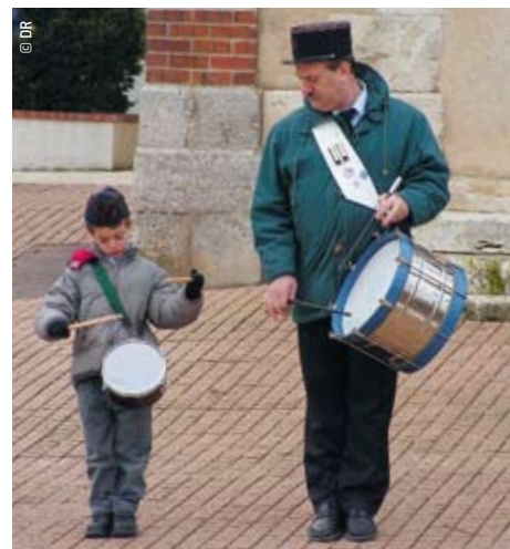
> La transmission du savoir, une tradition dans les fanfares.