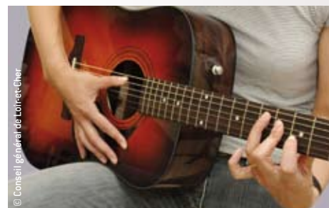
> L'un des objectifs du schéma est de permettre à chacun d'apprendre la musique, même loin des villes.

> L'Ensemble orchestral de Loir-et-Cher fait découvrir les œuvres musicales au plus grand nombre.