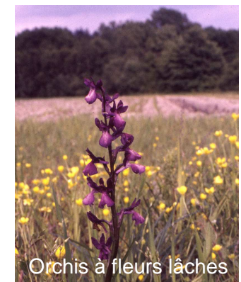
Orchis à fleurs lâches