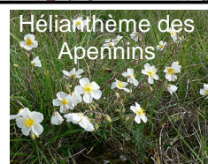
Hélianthème des Apennins