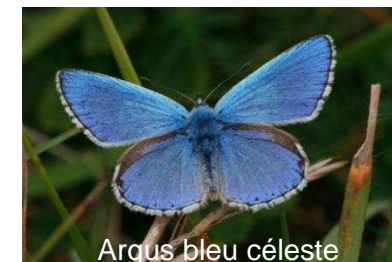
Argus bleu céleste