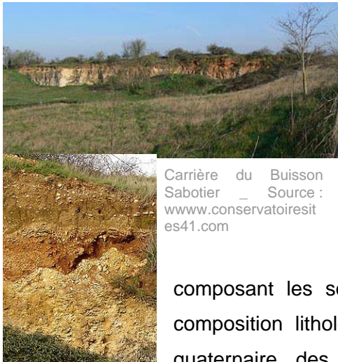
Carrière du Buisson Sabotier

Au cours des ères secondaire et tertiaire, le Loir-et-Cher (qui fait partie du bassin parisien), a été occupé par diverses mers dont la situation géographique et la profondeur ont varié. Les roches sédimentaires, marines ou continentales, composant les sous-sols du département, sont de composition lithologique et d'âge variables. A l'ère quaternaire, des limons d'origine éolienne se sont déposés sur les plateaux calcaires notamment en Beauce.