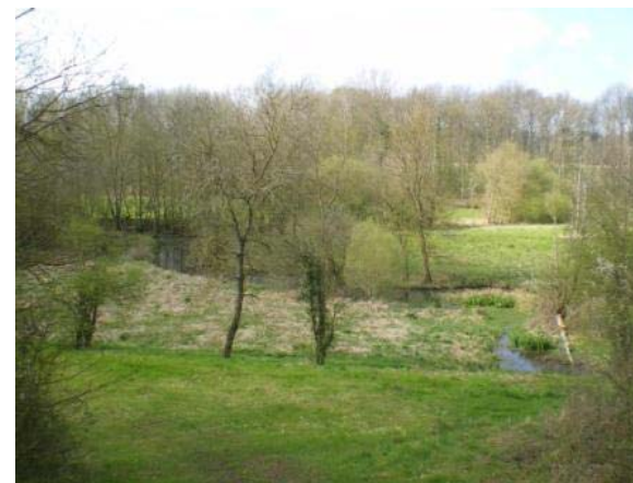
Vue à partir du site les Grouais de Chicheray

La Vallée du Loir constitue une entité paysagère bien marquée entre deux régions naturelles aussi différentes que la Beauce et le Perche. Les