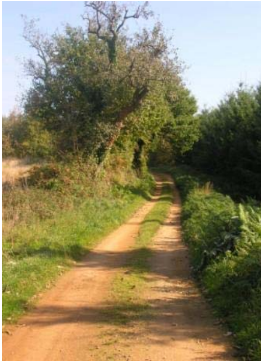
Bocage du Perche

A cheval sur l'Orne, l'Eure-et-Loir et la Sarthe, le Perche trouve sa limite méridionale dans le Loir-et-Cher.