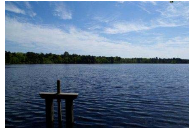
Étang des Levrys

La Sologne est une vaste dépression qui s'est progressivement comblée par des apports détritiques (sables et argiles). Cette vaste plaine, à peine inclinée d'Est en