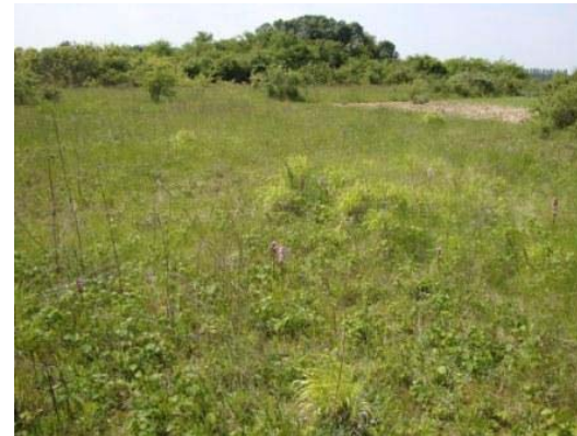
Éperon de Roquezon

La Beauce, vaste plateau calcaire, est une terre de grandes cultures. Son large parcellaire et son relief plat participent à l'image souvent monotone que l'on se fait de cette région, où l'arbre est rare et présent sous la forme de quelques bois et bosquets.