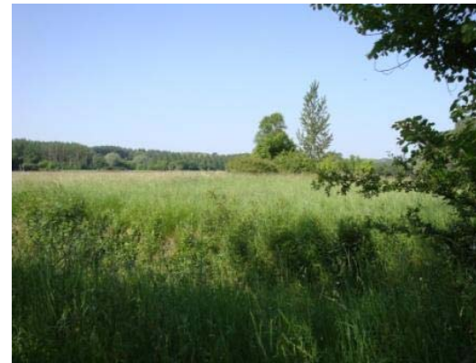
Prairies alluviales du Cher et du Fouzon

La vallée du Cher souligne le sud du département. On distingue dans la vallée le « Cher sauvage » au tracé sinueux en amont de Saint Aignan, et le « Cher canalisé » en aval, régulé par une série de barrages.