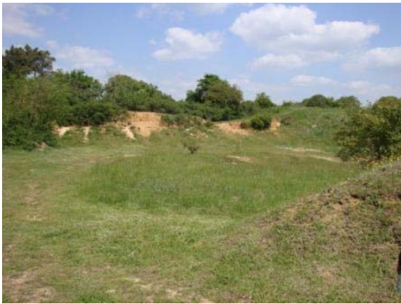
Carrière de la Fosse Penelle

La partie occidentale de la Sologne ou Sologne viticole est composée d'une mosaïque de terrains et de terroirs . Ainsi, les bois et forêts laissent place, ici, à diverses cultures (culture légumière, céréalière et viticulture), sur les sables filtrants .