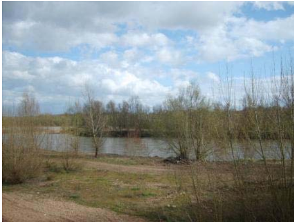
Vallée de la Loire

Traversant le département d'Est en Ouest, la Loire marque une grande coupure du territoire Loir-et-Chérien. Le Val de Loire est inscrit au patrimoine mondial de l'humanité par