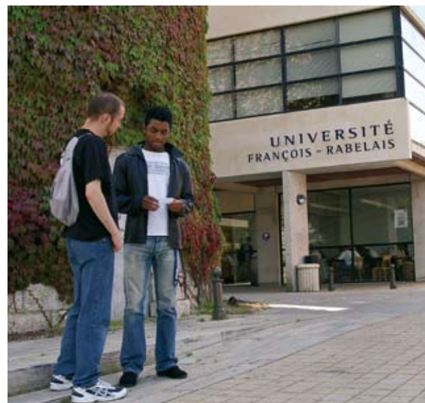
> L'IUT s'ouvre sur l'entreprise.

[Mai] et en 1982 avec le BTS Maintenance industrielle. Exemple : en 2007, étudiants et profs de Mai ont réalisé un banc de contrôle pour la société Dubuis et un poste d'assemblage pour Senior Automotive. ●