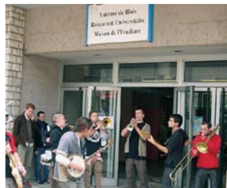
> À la Maison de l'étudiant, ambiance festive garantie !