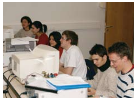
> Sur les cinq ans du cursus complet, l'étudiant réalise, au total, 13 mois de stages !

Mais l'aspect local n'est pas délaissé pour autant. En 4 e année, les étudiants ont un projet industriel... qui se déroule à 95 % au niveau régional car "il existe un réseau d'industriels locaux très dense qui leur propose des missions passionnantes", ajoute le directeur. Par ailleurs, un projet est cher à son cœur : l'aménagement de l'ancienne cantine Poulain qui abritera le Centre d'appui et de développement pour la recherche des entreprises (Cadre 41), en partenariat avec les collectivités locales,