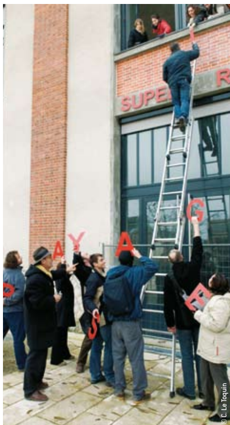
> Un nouveau lieu, ça se fête !