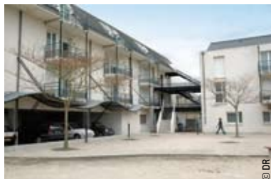
> La résidence universitaire rue du Pré-Rocheron à Blois-Vienne est composée de 80 appartements, soit 63 T1 et 17 T2.

Aujourd'hui, deux résidences universitaires existent à Blois : l'une rue de Flandres, l'autre rue du Pré-Rocheron (soit 170 lits). Un nouveau lieu devrait ouvrir ses portes au printemps 2008. Pratique, il est situé sur le site Gambetta, à deux pas de l'ÉNIVL et de l'ÉNSNP. Sa capacité d'accueil ? 151 logements, soit 161 lits supplémentaires.